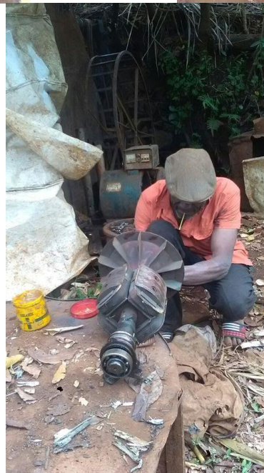
Quelques photos montrant la vétusté du matériel utilisé lors de la construction de la mini-centrale originale.