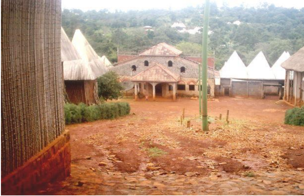
La façade de la chefferie supérieure de Bamendjou