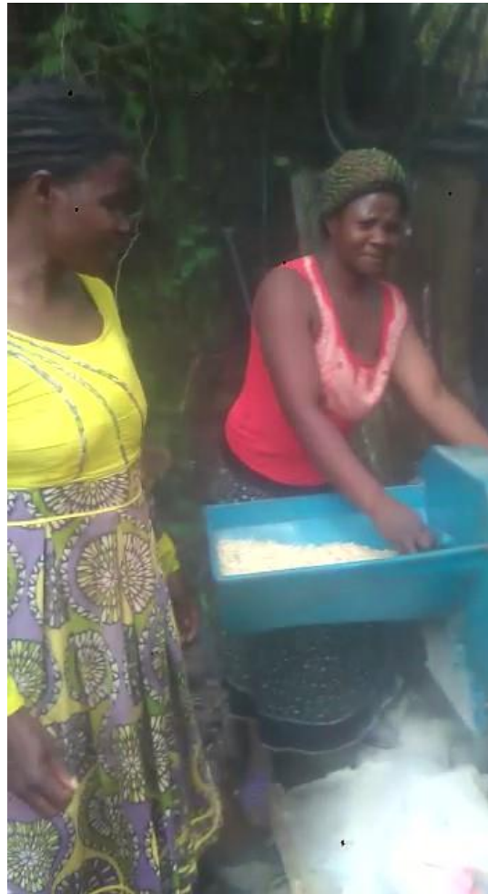
Une des moulinettes du village de Batchukang

par le groupe communautaire SIKAADIH dans le village de Batchukang (commune de Bamendjou au CAMEROUN)