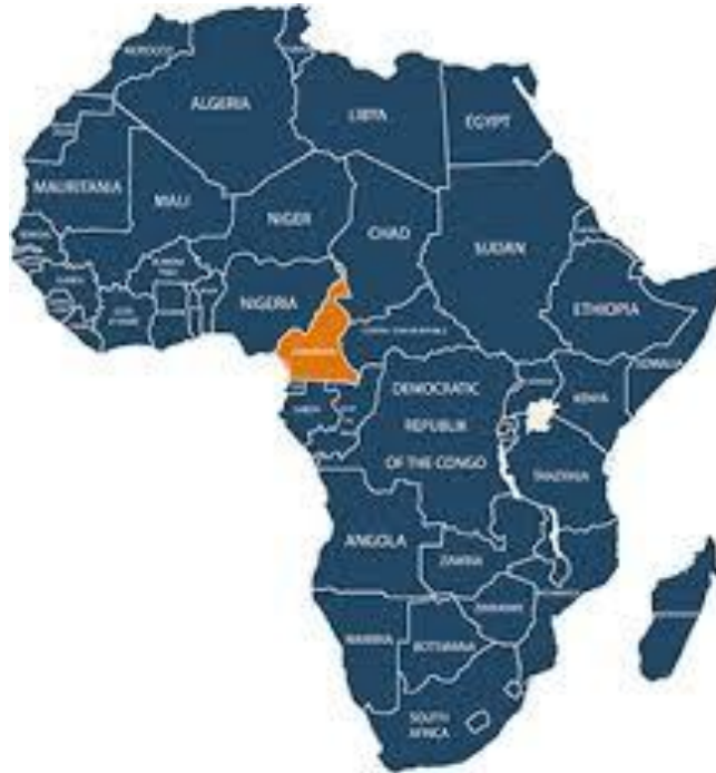
Carte de l'Afrique

Le Cameroun est un pays de l'Afrique centrale, situé sur le littoral de l'Atlantique. Sa population s'élève à environ 24 millions d'habitants.