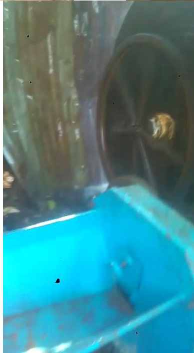
Les différents appareils que le groupe SIKAADIH a acheté avec notre aide financière

L'électricité permettra, à long terme, à cette communauté de passer d'une économie de subsistance à une économie de production.